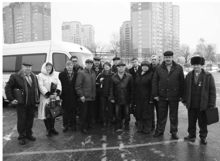
В составе делегации калужских коммунистов представители Людиновского МО КПРФ приняли участие во Всероссийском Совете трудовых коллективов. Март 2016г.

В отчёте дан анализ работы группы депутатов-коммунистов и их сторонников в Городской думе. По их инициативе был снят