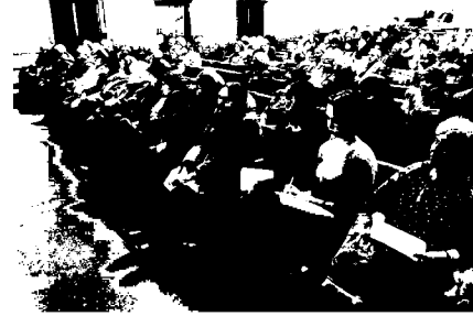
и другие участники конференции.