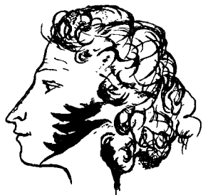
Автопортрет 1829 г.

Мы, коммунисты, испытываем особую гордость за рождение этого праздника на российской земле в начале нового века. Именно КПРФ вместе со всероссийским созидательным движением «Русский Лад» инициировали указ Президента РФ об учреждении Дня русского языка 6 июня 2011 года. А мне, как сыну сельских учителей, этот праздник особенно дорог.