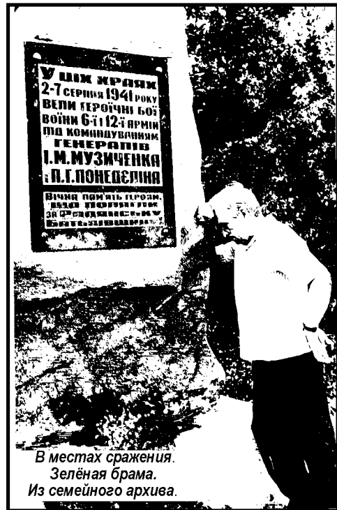
В местах сражения. Зелёная брама.

ждена от немцев. Полевой военкомат, ввиду тяжёлого ранения в голову, дал мне броню до конца войны, и я остался работать на восстановлении электростанции. Сначала работал слесарем 7 разряда, потом стал бригадиром. Горком комсомола поручил мне организовать первичную комсомольскую организацию на электростанции, и я возглавлял её 2 года. Комсомольская организация проводила читки газет в госпиталях и много помогала подшефным колхозам. Комсомол работал под лозунгом «Всё для фронта, всё для Победы!» На электростанции мы пустили первый маленький агрегат, он был трофейный, давали ток госпиталям, хлебозаводу, военным штабам.