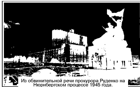
Из обвинительной речи прокурора Руденко на Нюрнбергском процессе 1945 года.

Преступники захватили власть в государстве и сделали само государство орудием своих преступлений.