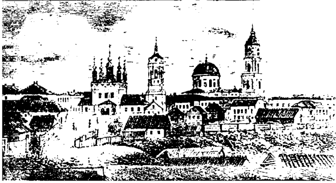
Калуга. Церковь покровы Пресвятой Богородицы, что на рву. Из «Строельной книги Калуги» конца XVI века, времён царя Фёдора Иоанновича... Kaluga-pokrov.cerkov.

Город Калуга – административный центр Калужской области. Расположен на берегах реки Оки в 188 км к юго-западу от Москвы. Впервые Калуга была упомянута в 1371 году в жалобе византийскому патриарху литовского князя Ольгерда на то, что московские князья захватили литовские города и в том числе город Калугу. Вторично Калуга упоминается в духовной Дмитрия Донского от 1389 года, завещавшего Калугу своему сыну Андрею «... а Калуга и Роща сыну же моему князю Андрею». Других источников не обнаружено, хотя можно предполагать, что город был гораздо раньше указанной даты и существовал как деревня. Слово «калуга», есть предположение, происходит от слова «халуга» - место, огороженное тыном; от слова «калужа» - топь, болото; от названия реки Калужки. Точного толкования этого слова пока нет. Скорее всего, это слово из финского языка, т. к. наши места до прихода вятичей населяли угро-финские племена.