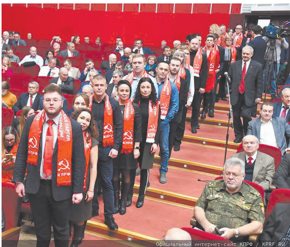
Официальный интернет-сайт КПРФ / KPRF.RU