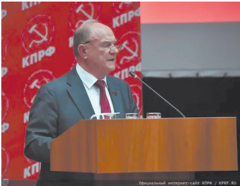
Официальный интернет-сайт КПРФ / KPRF.RU

1. О работе КПРФ по выполнению Программы Победы;