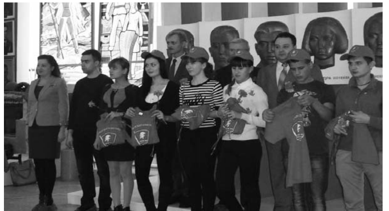
Прием в комсомол в Народном музее истории ЛТЗ.